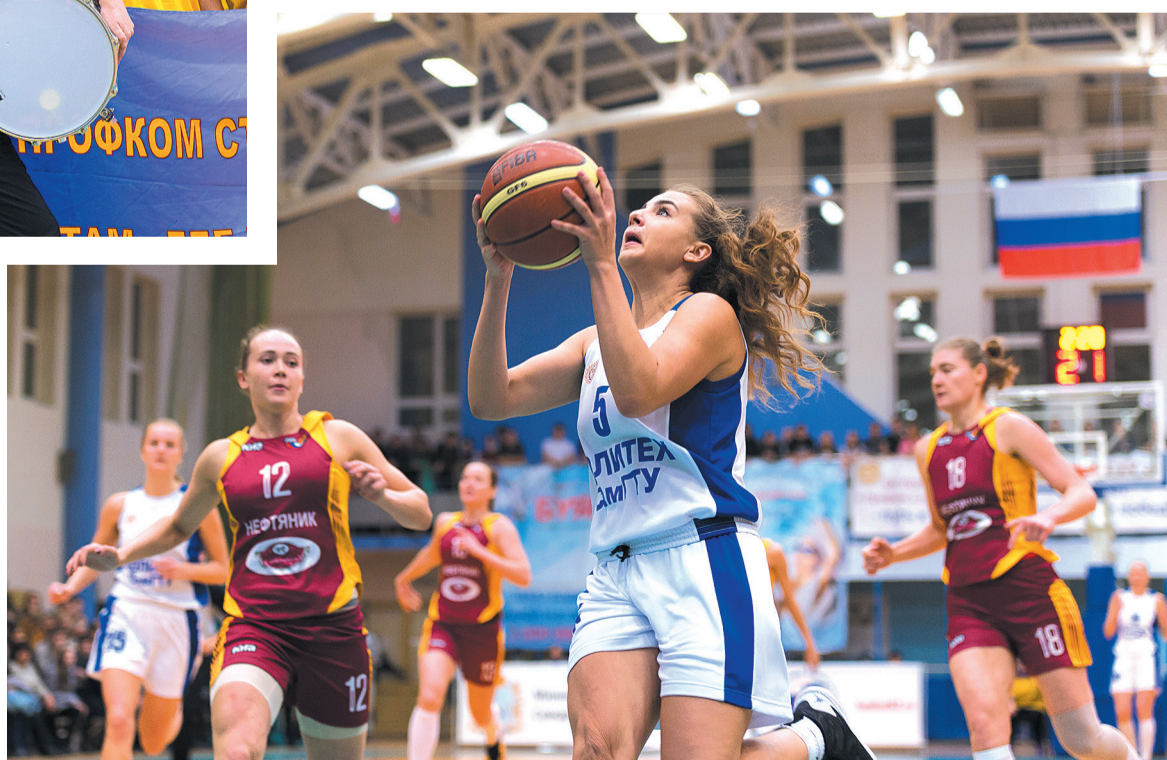
Подарком для преданных болельщиков в честь 15-летия клуба стала уверенная победа баскетболисток Политеха над омской командой «Нефтяник-Авангард» со счётом 60:47.