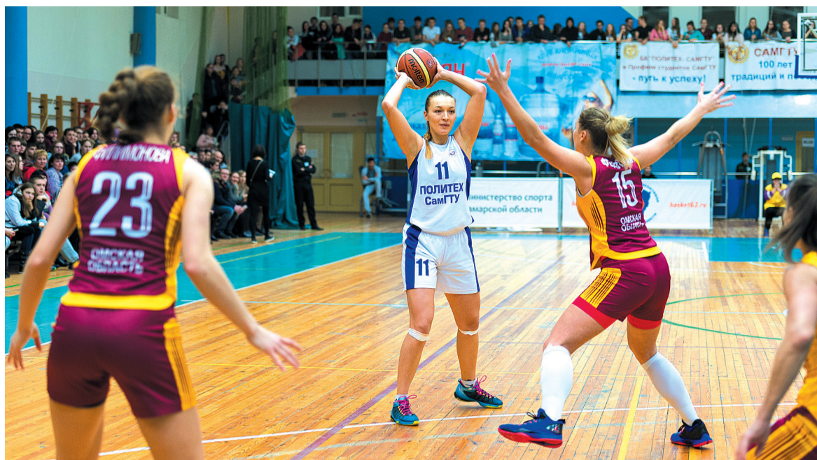
Омская команда оказалась сильным соперником и не собиралась уступать.