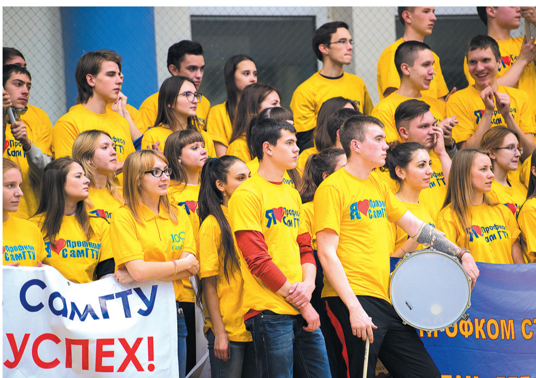
Болельщики «Политеха», как всегда, поддерживали свою команду.