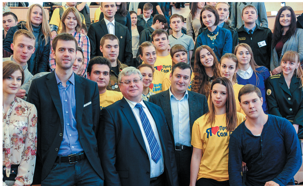
На память у студентов СамГТУ останется фотография с Александром Хинштейном.