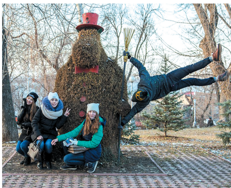
Участники фотоквеста побывали в Струковском саду.

– Спасибо организаторам за игру! Хорошо провели время. Правда, подвёл телефон, который не хотел загружать фото с домом на Осипенко, и нам пришлось не раз туда возвращаться. Задания хорошие, несложные. Вы молодцы!